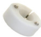
Dual magnet, Nylon collar