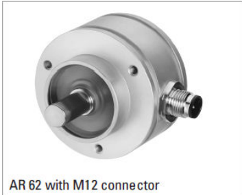
AR 62 with M12 connector